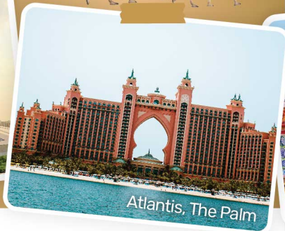
Atlantis, The Palm