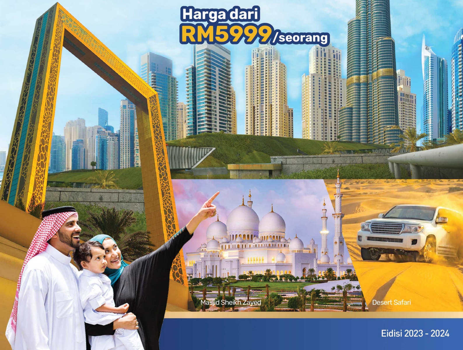
Masjid Sheikh Zayed